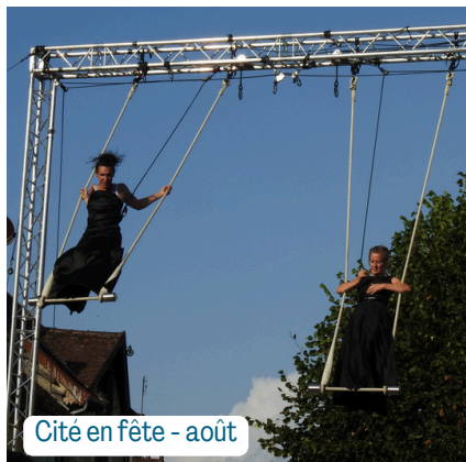
Cité en fête - août