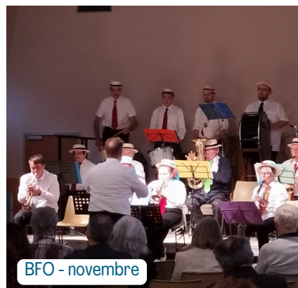
BFO - novembre