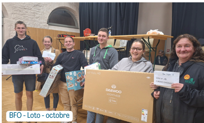
BFO - Loto - octobre