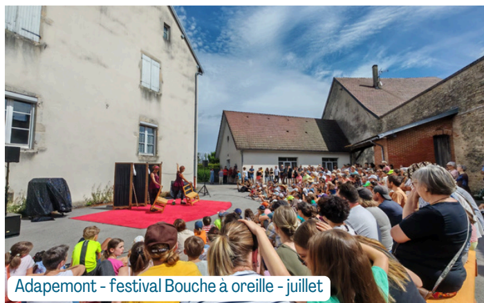
Adapemont - festival Bouche à oreille - juillet