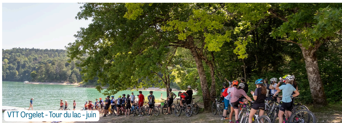
VTT Orgelet - Tour du lac - juin