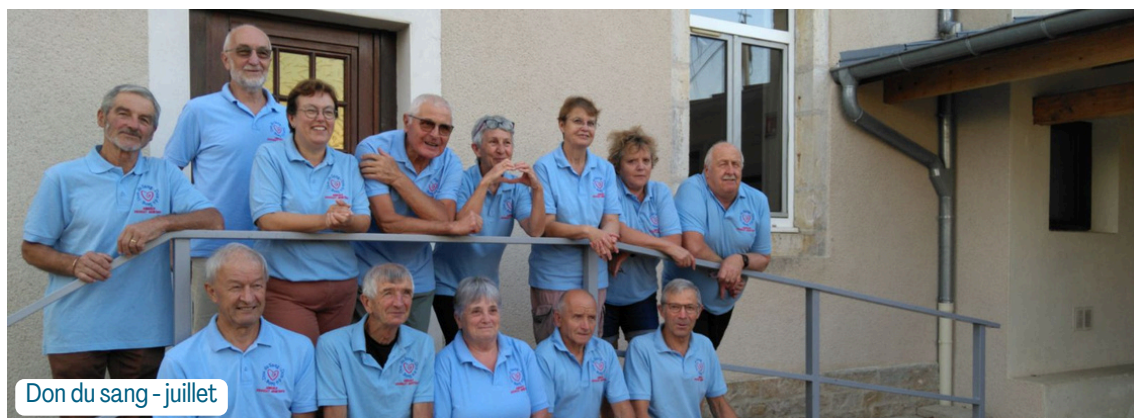
Don du sang - juillet