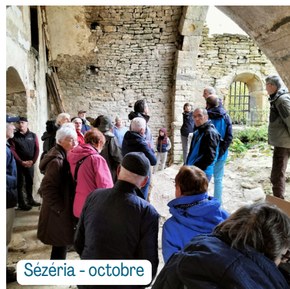
Sézéria - octobre