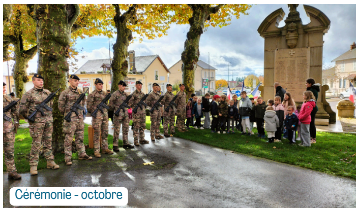
Cérémonie - octobre