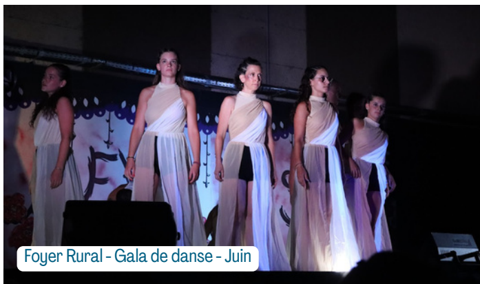
Foyer Rural - Gala de danse - Juin